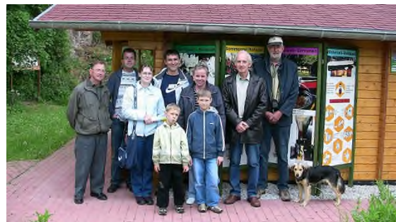
Imkerverein Wiehe zu Besuch im Bienen-Lehrgarten des Imkervereins Nebra in Nebra